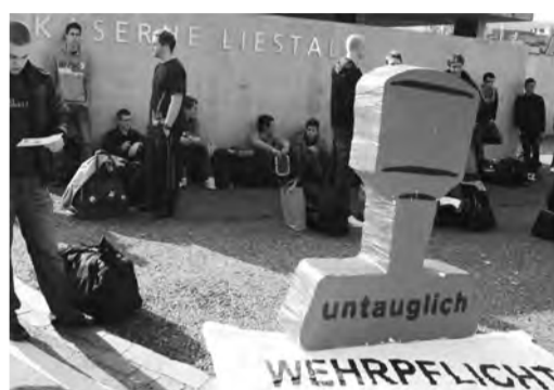
Die GSoA sammelt Unterschriften am Einrückungstag der Winter-RS in der Kaserne Liestal

Angesichts der schon fast surreal anmutenden neuen Pläne der bürgerlichen Armeepolitiker – Noch mehr Geld für die Armee! Neue Kampf-