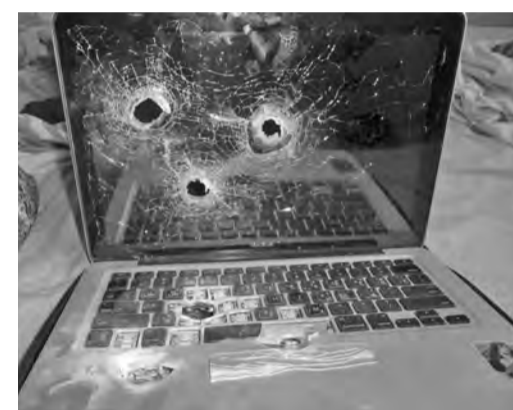
MacBook mit Einschusslöchern. Ob sich der Generalstab «Cyberwarfare» so vorstellt?