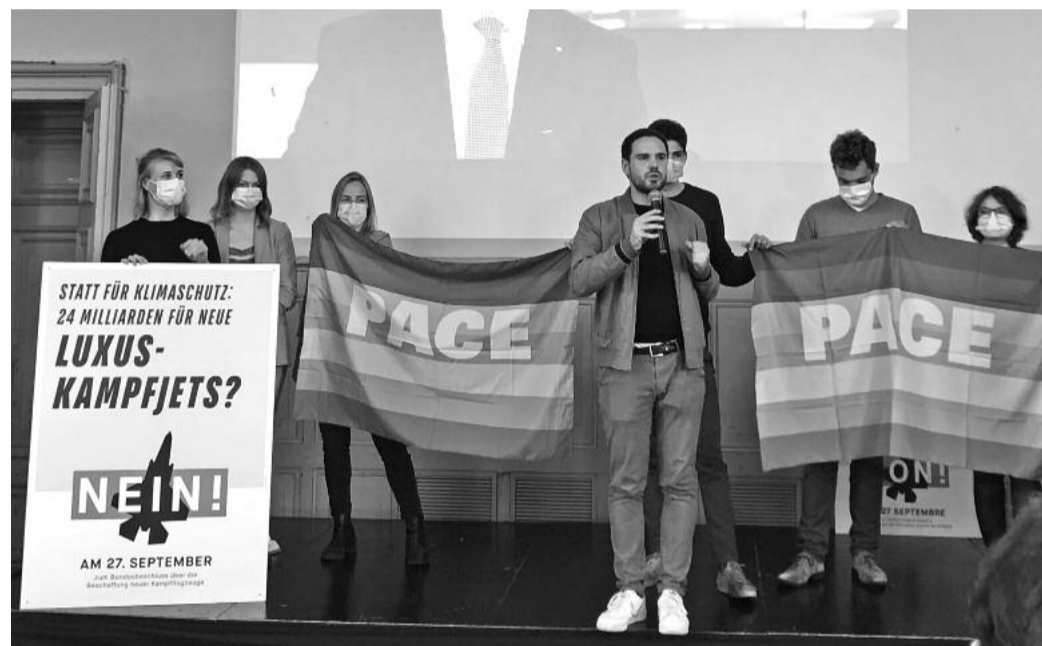
Das Kampagnenteam am Abstimmungsanlass vom 27. September 2020.